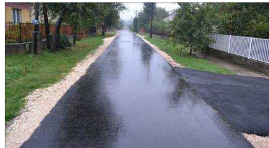
A teljes egészében megújult Tatai utca

A munkálatokat folyamatosan műszaki ellenőrral ellenőriztettük, így tehát valóban a szerződésnek megfelelően jó